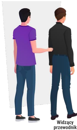
Rys. Technika poruszania się z widzącym przewodnikiem

Poruszając się z osobą niewidomą, należy pamiętać, że przewodnik zawsze i wszędzie idzie pierwszy, a osoba niewidoma pół kroku za nim. Jako przewodnik należy obserwować nie tylko drogę przed sobą i osobą niewidomą, lecz także przestrzeń obejmującą jej tułów i głowę. Pozwoli to uniknąć ewentualnego narażenia na zderzenie z elementami wystającymi poza obręb ściany, np. wiszącymi. Tempo poruszania się powinno być dostosowane do możliwości osoby niewidomej.