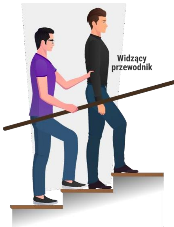
Rys. Korzystanie z technik poruszania się z przewodnikiem na schodach

Aby ostrzec osobę niewidomą przed jakimś niebezpieczeństwem, należy zasygnalizować konkretną przeszkodę. Sam okrzyk „Uważaj!” nie pozwoli jej zorientować się, o jaką przeszkodę chodzi, czy ma się zatrzymać, uciekać, pochylić, czy może coś przeskoczyć. Podczas ewakuacji osób z dysfunkcjami wzroku należy pamiętać, że: zmiany zachodzące w szybkim tempie powodują ich dezorientację, panikę, stres, niechęć lub niemożność działania; nie reagują one na wizualne efekty towarzyszące zagrożeniom; mają trudność poruszania się bez przewodnika w terenie nieznanym lub znanym, lecz o zmienionej charakterystyce; mają dobrze rozwiniętą pamięć przestrzenną najbliższego otoczenia, dlatego w przypadku usłyszenia komunikatu o ewakuacji, będą najprawdopodobniej kierowały się drogą, którą znają, a która może prowadzić np. do ogniska pożaru, stąd tak ważne jest wskazanie im osoby do pomocy.